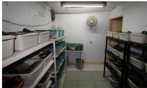
Fotografía No. 2. Bioterio del zoológico Santa Fe.