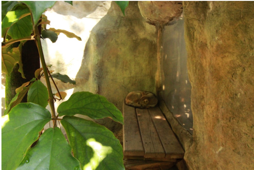
Fotografía No. 14. Recintos de exhibición de ejemplares de Cerdocyon thous en el Parque Zoológico Santa Fe.