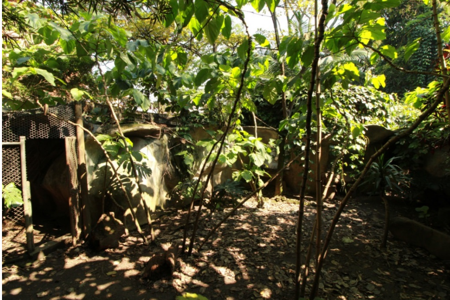
Fotografía No. 13. Recintos de exhibición de ejemplares de Cerdocyon thous en el Parque Zoológico Santa Fe.