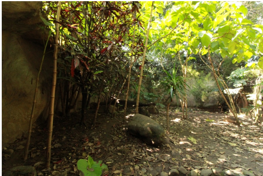
Fotografía No. 12. Recintos de exhibición de ejemplares de Cerdocyon thous en el Parque Zoológico Santa Fe.