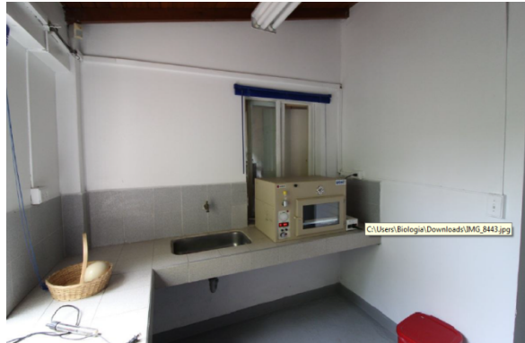
Fotografía No. 6 y 7. Zona de cría incubación del zoológico Santa Fe.