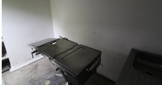
Fotografía No. 3. Sala de necropsia del zoológico Santa Fe.