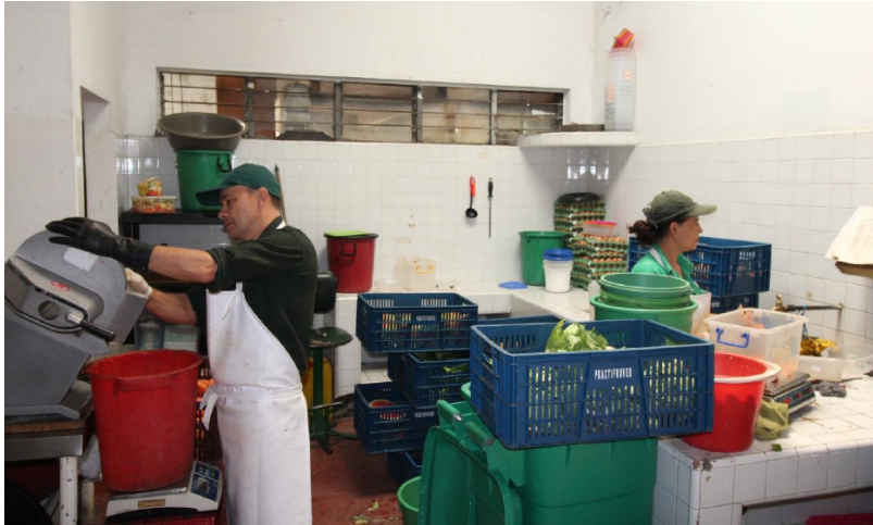
Fotografía No. 1. Cocina del zoológico Santa Fe.

Vías de acceso: Al norte: por la calle 25, al occidente con la carrera 52 con la (avenida Guayabal, sentido sur norte), al sur con la calle 21, y con el oriente con la carrera 52 a Barrio Santa fe.