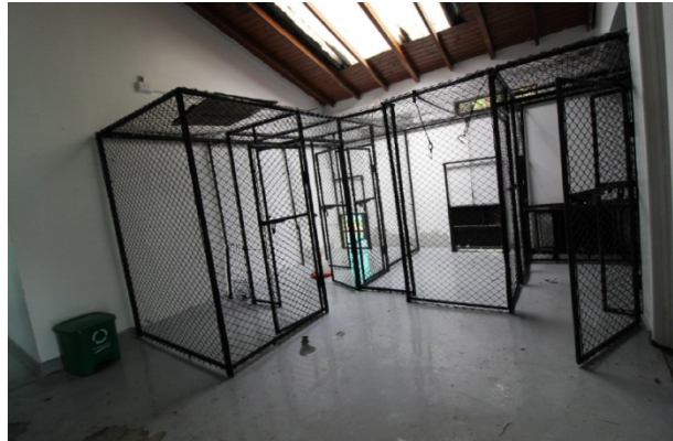
Fotografía No. 8. Zonas de cuarentena del zoológico Santa Fe.