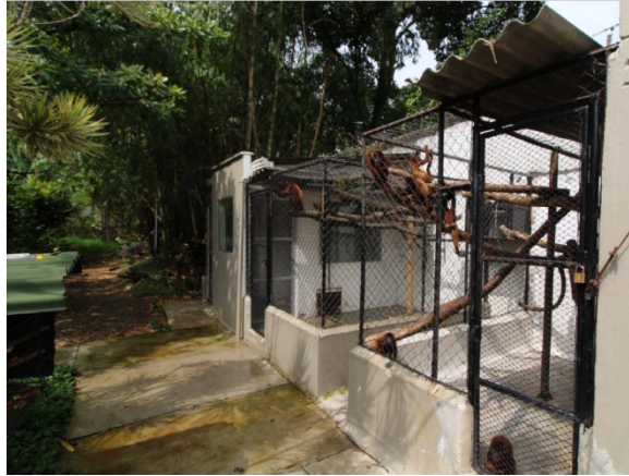
Fotografía No. 9. Zonas de cuarentena del zoológico Santa Fe.

El zoológico/acuario cuenta con una exhibición diseñada y habilitada a las necesidades físicas y biológicas del espécimen.