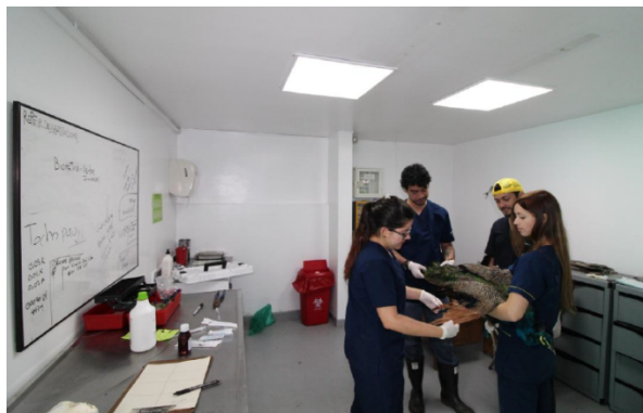
Fotografía No. 4. Clínica veterinaria del zoológico Santa Fe.