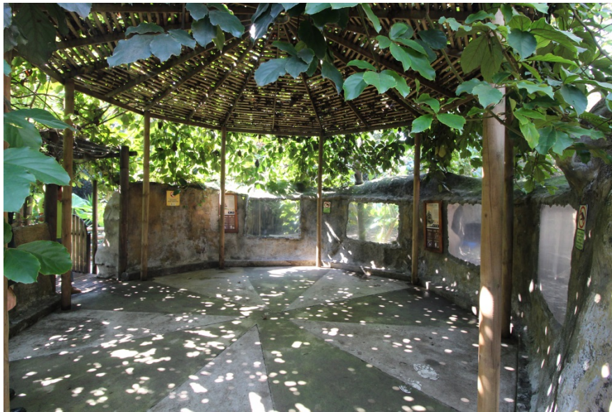
Fotografía No. 10. Recintos de exhibición de ejemplares de Cerdocyon thous en el Parque Zoológico Santa Fe.

Según lo relacionado por El Parque Zoológico Santa Fe en los documentos remitidos, este zoológico cuenta con una exhibición diseñada y habilitada para las necesidades de la especie Cerdocyon thous , como se puede evidenciar en las fotografías relacionadas (Fotografías No. 11 a 14), haciéndolo apto para el manejo de fauna silvestre.