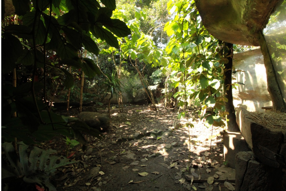
Fotografía No. 11. Recintos de exhibición de ejemplares de Cerdocyon thous en el Parque Zoológico Santa Fe.